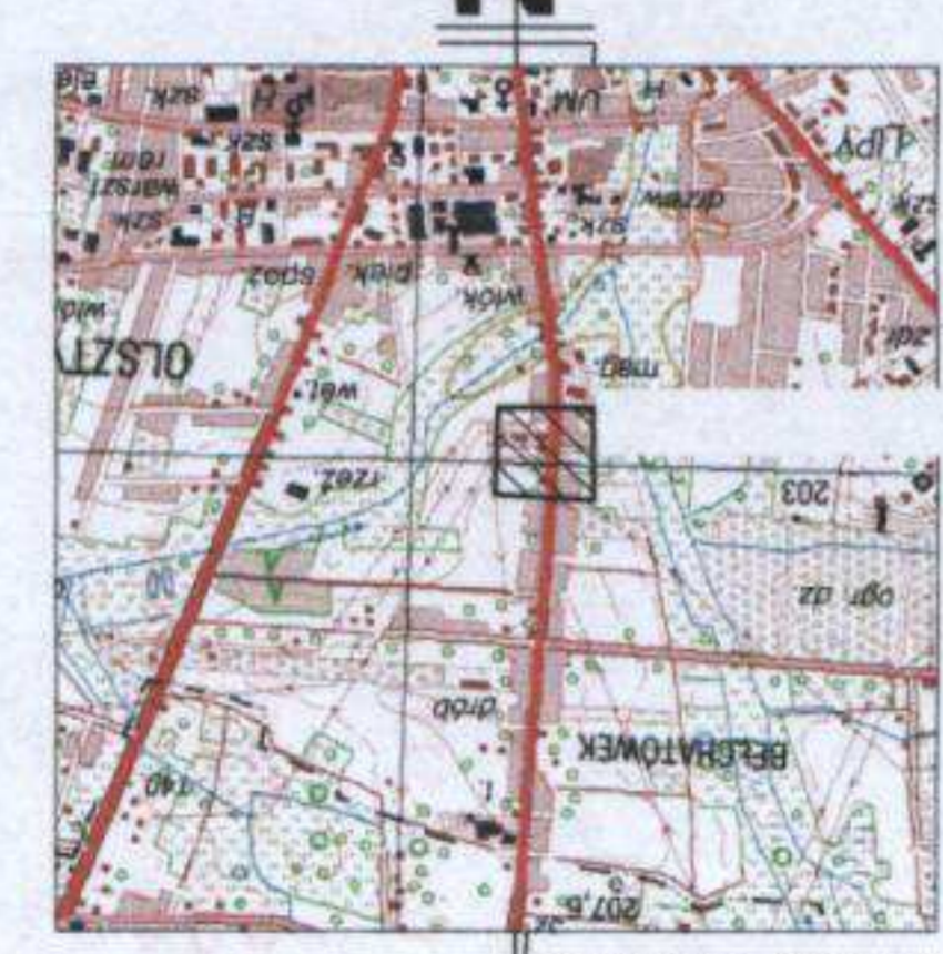
Szkiełko lokalizacji w skali 1:50000

Granice według danych ewidencyjnych. Data opracowania mapy: 25.07.2012r. Mapa aktualna na dzień 25.07.2012r. Brak obciążeń działek służebnościami.